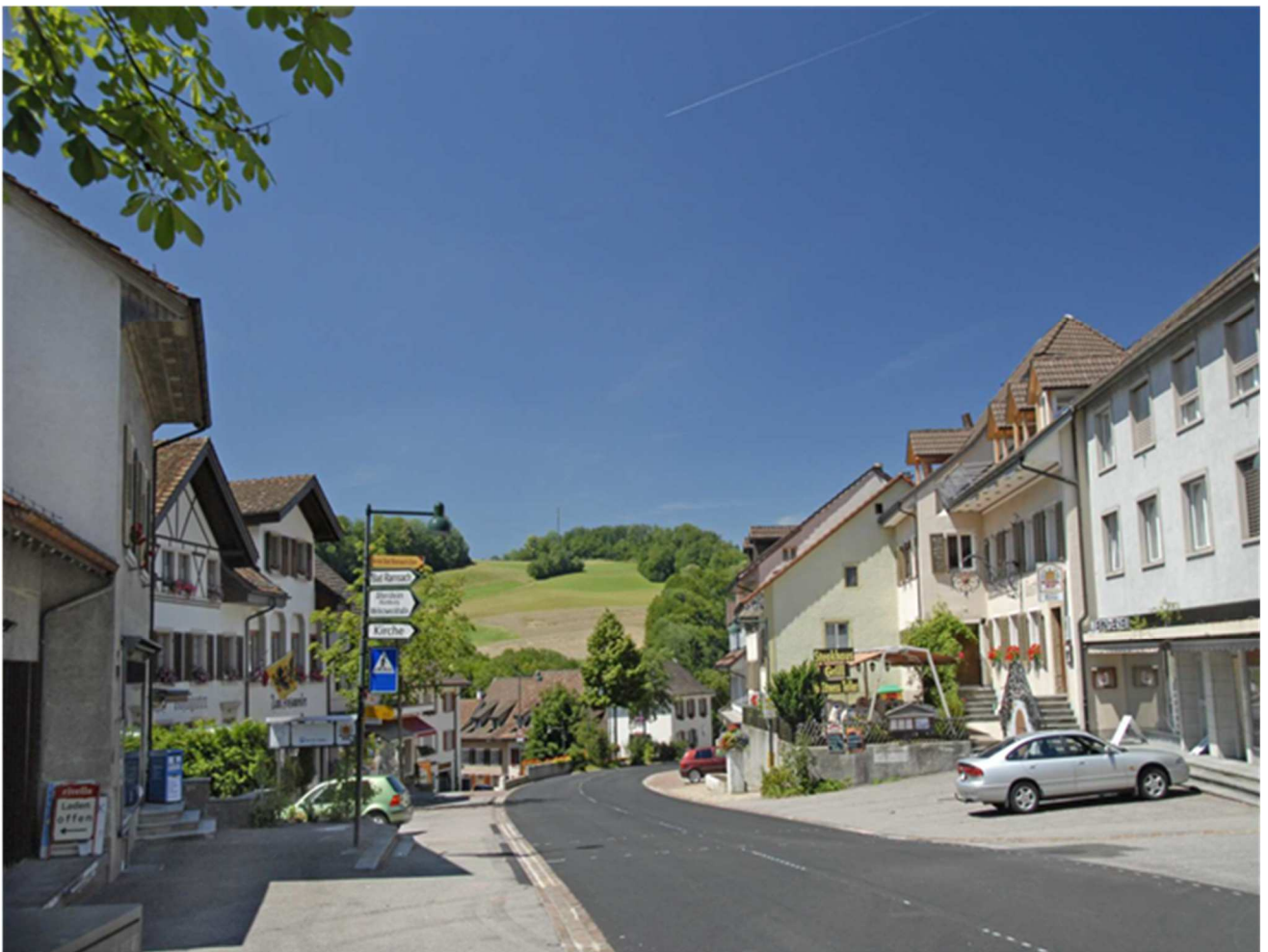
Läuelfingen im Wandel der Zeit – Hauptstrasse im 2007

von 09.00 – 12.00 Uhr und 14.00 – 17.00 Uhr